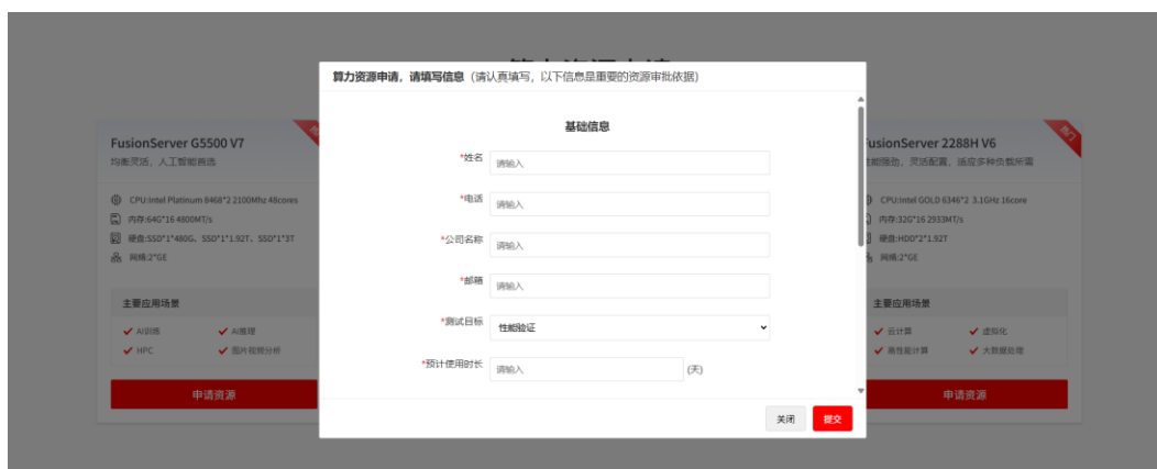
表 1: 申请需求表单“基础信息”描述