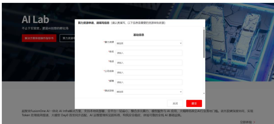
表 1: 申请需求表单“基础信息”描述